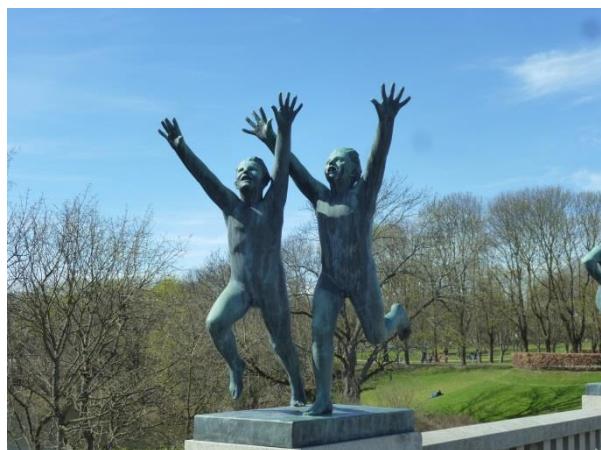
Staty i Vigelandsparken får avsluta årsmötet