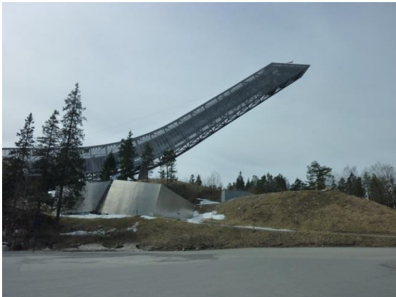
Hoppbacken, som verkar försvinna upp i skyn