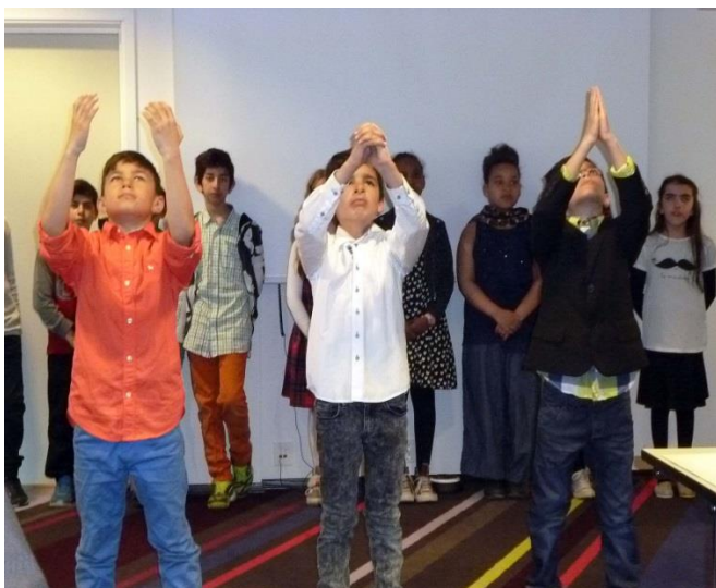
Elever i fjärde klass från Fjell skole, i rollspel om mångfald och integrering